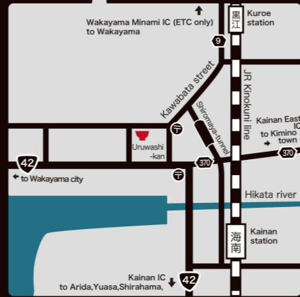
「わがまち元気」計劃支援補助金 / 運用紀州漆器打造黑江品牌的構築協議會