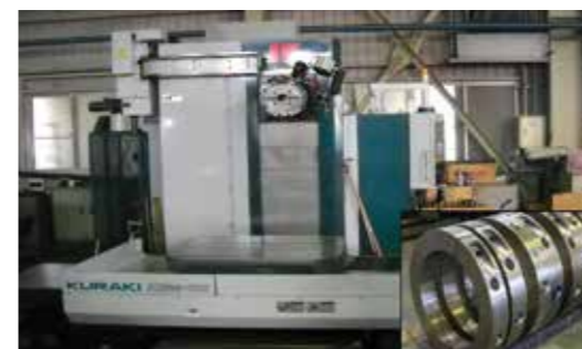
▲CNC横中グリフライス盤

一方、社内に目を向けると60歳を超える従業員が前線で活躍しており、世代交代を進めていかなければならないタイミングに差し掛かっている。社内の若返りと技術の継承を進めつつ、次の一手を模索していく。