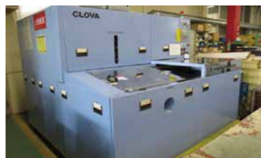
▲全自動洗浄機外観

率の向上を図るために、社内でも要求の多かった自動洗浄機の導入を進めることとした。数ある洗浄機のなかでも操作が格段に優れ「洗浄→乾燥」の精度が高いワンバス式全自動洗浄機を導入した。