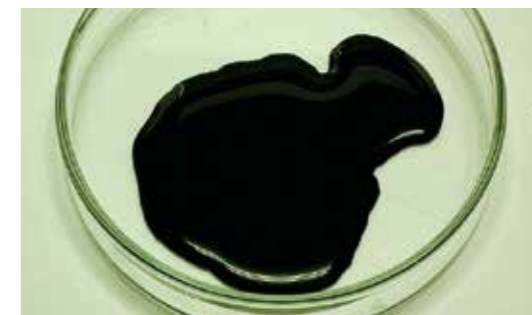
▲インク向け備長炭ペースト

ただ、インクの分散性が2～3カ月程度しか保てないという問題点を抱えている。今後は、得意先から要望されている6カ月程度まで延ばせるよう、研究開発を進めていく。