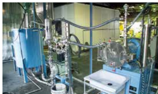
▲導入した湿式粉砕機

そこで、今回の補助事業では、備長炭、竹炭を原料とした人体に安全な黒色顔料インクの開発を行った。まずは、備長炭、竹炭を粉砕するための湿式粉砕機を購入し、実用化を試みた。