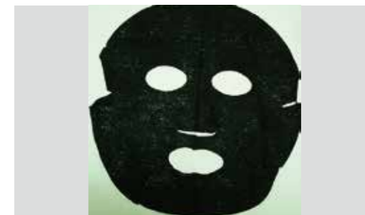
▲備長炭練り込みフェイスマスク