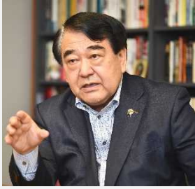
寺島 実郎 氏