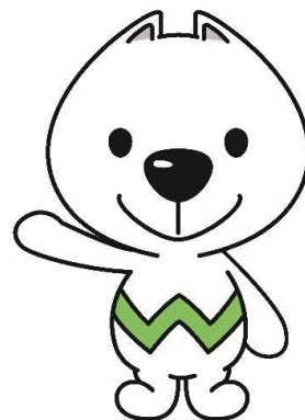
和歌山県PRキャラクター 「きいちちゃん」

中小企業の皆さんの負担を軽減するため、「低利・固定・長期」の資金とし、信用保証料についても県が一部負担しています。